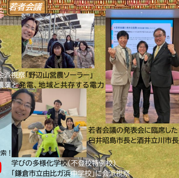
若者会議の発表会に臨席した白井昭島市長と酒井立川市長